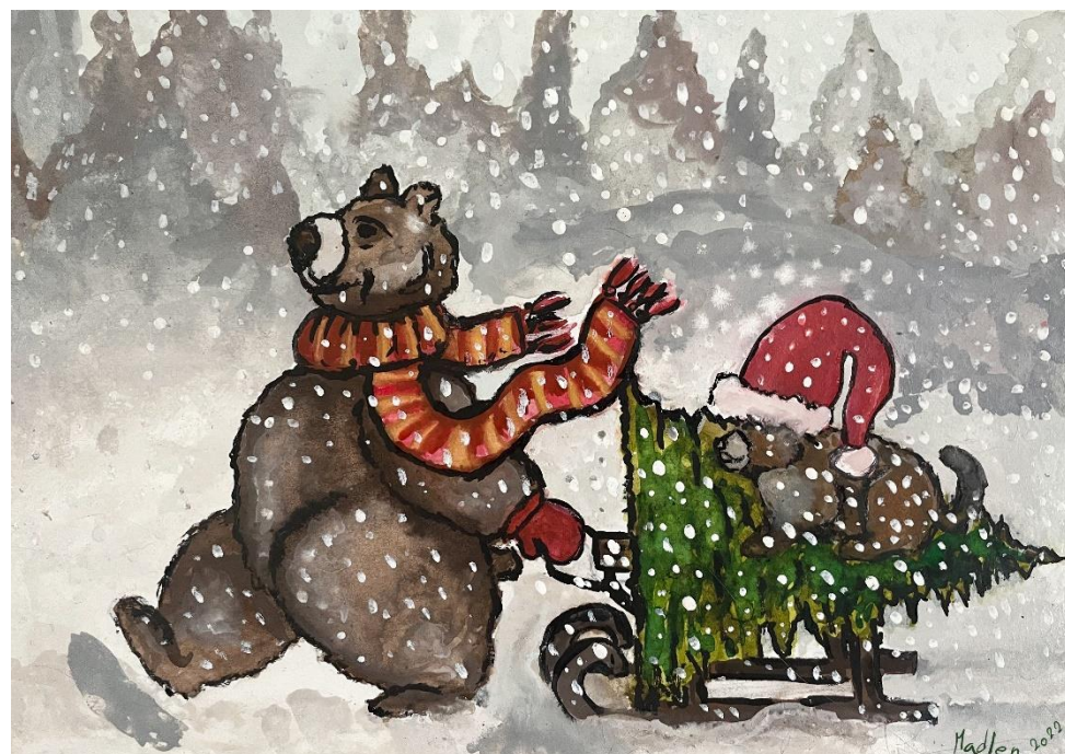
Madlen (13 let), zhoubný nádor kosti

V posledních dnech roku 2022 se nám podařilo odhalit falešnou webovou stránku vydávající se za nadaci Dobrý anděl , na níž bylo uvedeno falešné číslo účtu nepatřící nadaci. Obratem jsme podali trestní oznámení na Policii ČR. Díky rychlé a vstřícné pomoci Raiffeisenbank došlo k zablokování falešného účtu v řádu několika hodin. Podvodná webová stránka pak byla poskytovatelem zablokována během několika dnů po našem upozornění.