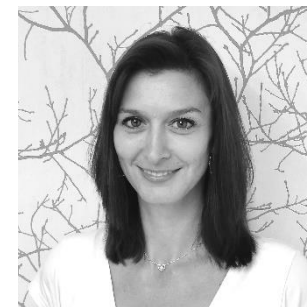
Romana Grauová péče o rodiny a dárce